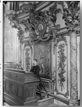
Bibliothèque centrale de Versailles : fin 19 ème siècle

a lumière...), et un génie auquel l'art, l'industrie et la religion doivent une égale reconnaissance » pouvait-on lire en 1870.